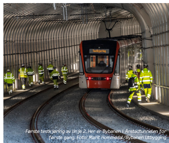
Første testkjøring av linje 2. Her er Bybanen i Anstad-tunnelen for første gang.

Fagområdet Spor har flest periodiske jobber som bl.a. regelmessig skinnesliping, rengjøring og smøring av sporveksler, tømning av slakkummer, rillerens og faste inspeksjoner og kontroll av spor. I tillegg har en av medarbeiderne på spor funksjon som kjøretøysansvarlig for alle kjøretøy i selskapet.